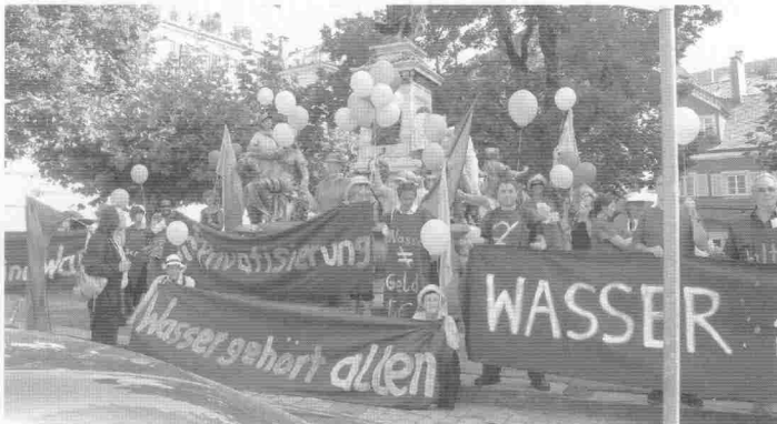
Wasser ist Zukunft - Wasser ist Leben - Wasser: Ein Grundrecht für alle!

Mit Aktionen am Bodensee setzt sich die Wasserkarawane für das Wasser ein. Auftakt der Veranstaltungsaktivitäten war 2004 das Bodensee-Wasser-Festival in Überlingen. 2005 zog die Karawane von Kamelen begleitet von Überlingen nach Bregenz. Mit dieser einwöchigen Wanderung am See entlang hat die vielköpfige Karawane über die Machenschaften privater Investoren und die Gefahren der Privatisierung unseres wichtigsten Lebensmittels WASSER die Bürger durch unterschiedlichste Aktionen informiert. Wichtig waren uns vor allen Dingen künstlerische Darbietungen, um sich dem Wasser emotional und über ein eigenes Erleben zu nähern, nicht nur intellektuell.